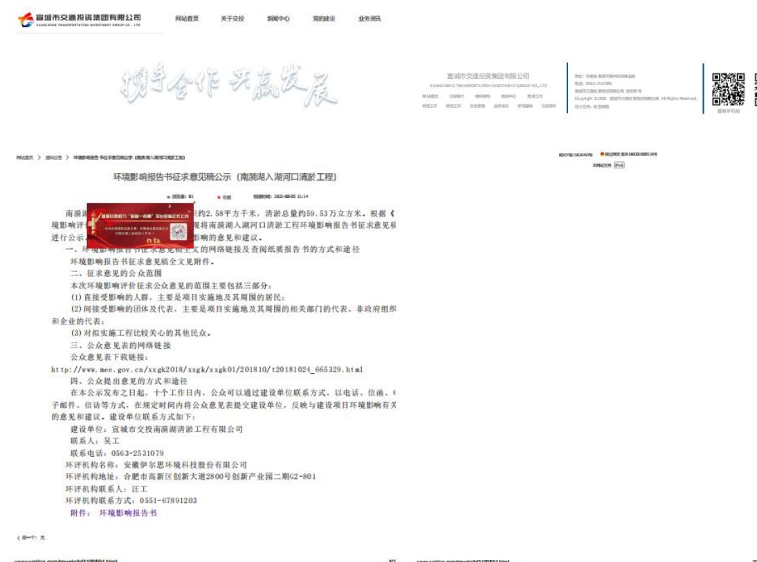
图 2 第二次公示网站截图

第二次公示在在宣城市交通投资集团有限公司官网上进行网上公示，便于周边公众知悉，符合《环境影响评价公众参与办法》的相关要求。公示时间为2022年8月5日至 2022年8月18日期间，公示网址及网站截图如下，网址： http://www.xcsjtgs.com 。