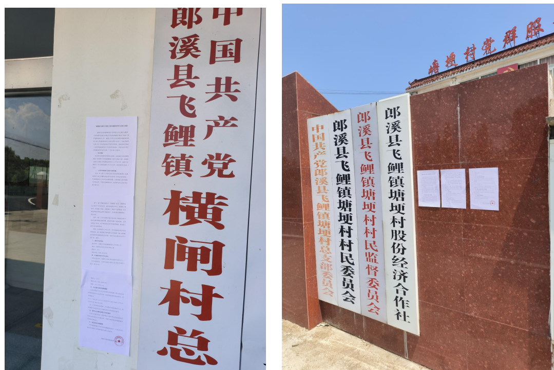
图 4 张贴现场图

建设单位于2022年8月6日在横闸村、塘埂村等村庄的村委会张贴公告，现场照片见下图。