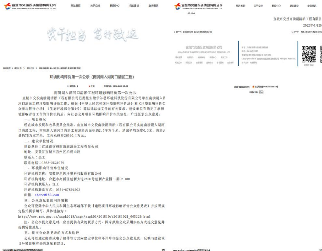
图 1 第一次公示网站截图