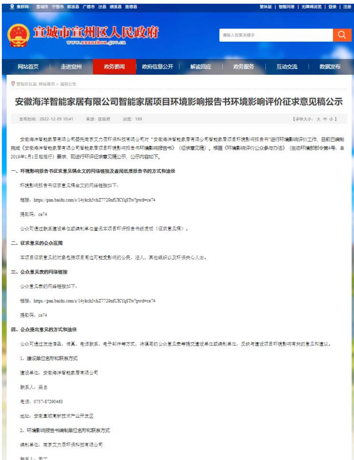
图3.2-1 本项目首次公示网络截图