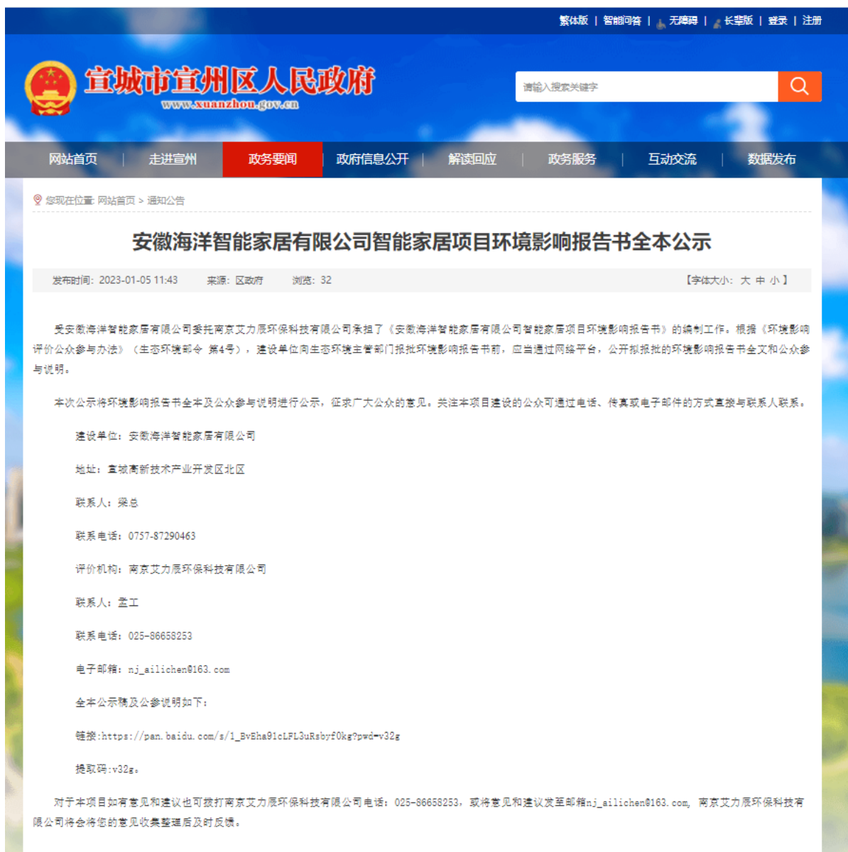
图4.2-1 报批前全本公示截图