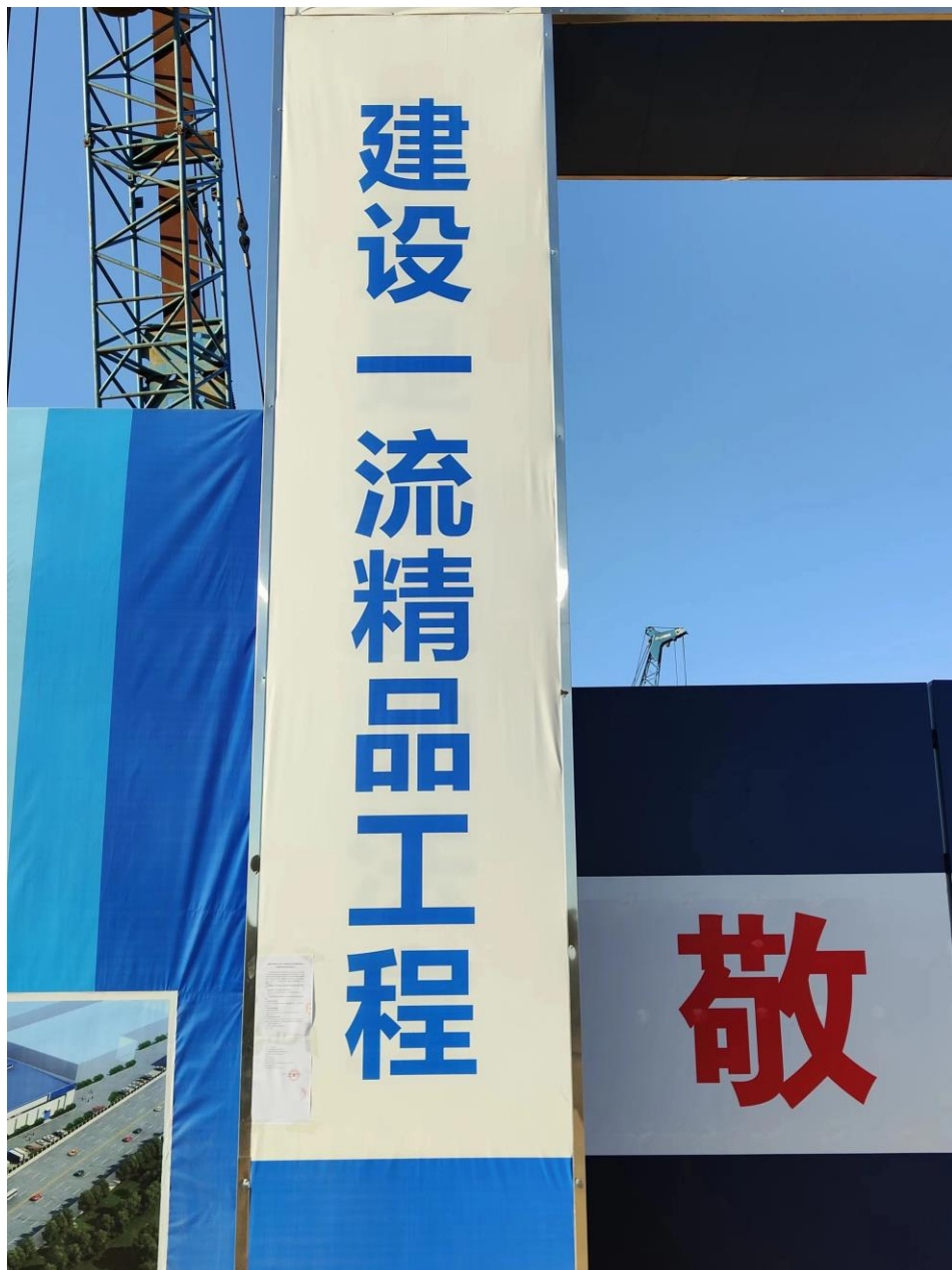
图2.2-5 现场张贴公告内容