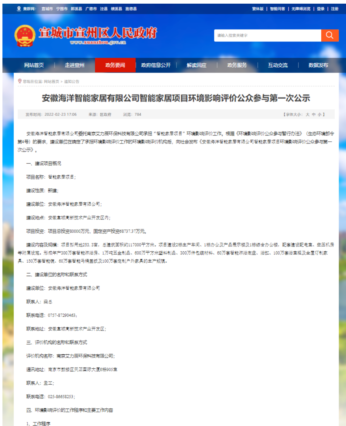
图2.2-1 本项目首次公示网络截图